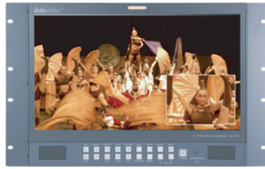
TLM-170HR 7Uサイズ19インチラックマウント型